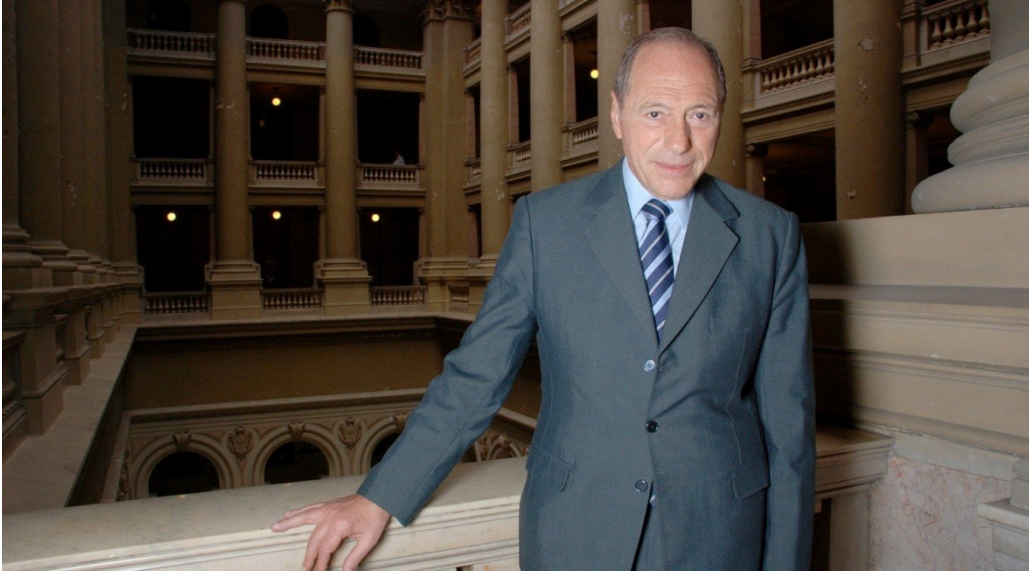
Dr. Raúl Zaffaroni, integrante de la Corte Interamericana de Derechos Humanos y profesor emérito de UBA