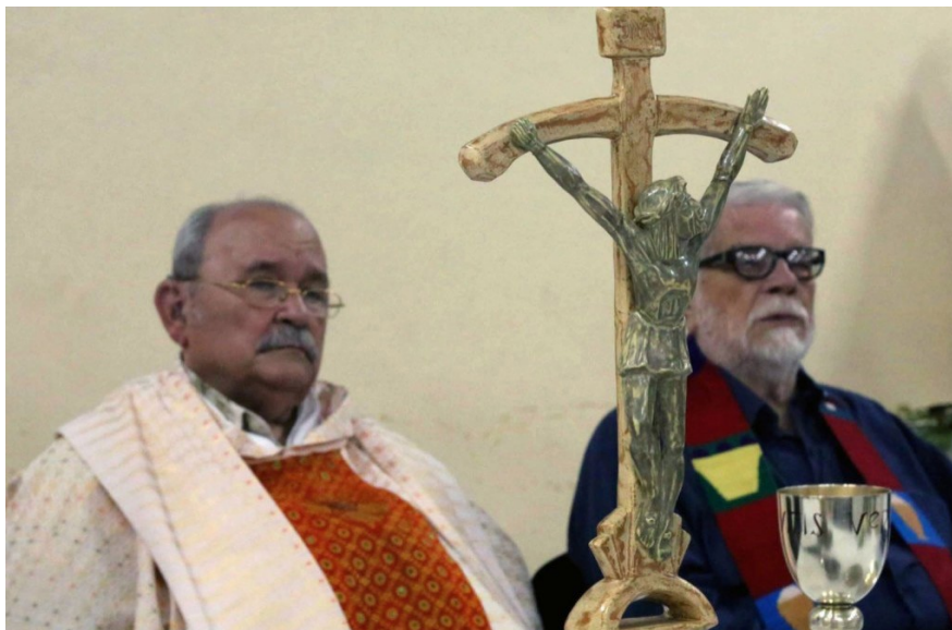
Sacerdote Miguel D'Escoto, da su primera misa tras revocación de su suspensión

DISCURSO INAUGURAL DEL PADRE MIGUEL D'Escoto BROCKMANN AL ASUMIR LA PRESIDENCIA DEL 63ª PERIODO DE SESIONES DE LA ASAMBLEA GENERAL DE ORGANIZACION DE LAS NACIONES UNIDAS